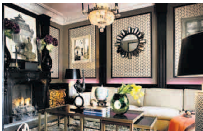
Vorherrschende Farben sind Schlamm, Khaki und Braun. Akzente setzen kräftige Gelb-Töne, wie hier etwa die Blumen auf dem Tisch. In anderen Räumen sind es prächtige Stehlampen.

Schlamm, Khaki und Braun. Die Wände sind teilweise mit Samt im Streifen-Design bespannt oder tapeziert. Farbliche Akzente bilden kräftige Gelb-Töne, etwa in Form von Stehlampen, die auf einem Sideboard im Stil der amerikanischen 50er-Jahre stehen. Darüber hängt eine Fotografie, die eine Pool-Szene zeigt – gekonntes Spiel mit Kontrasten und Stilen! Einladend ist das große helle Sofa, von dem aus man den prächtigen Kamin gut im Blick hat. Dieser wurde, wie die Kapi-