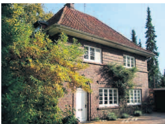
Die Wohnfläche des 10-Zimmer-Hauses beträgt insgesamt 254 Quadratmeter.

zimmer verbunden. Im Obergeschoss liegen vier Räume mit Pitchpineböden sowie ein neuwertiges Bad. Zwei Zimmer haben einen Zugang zur großen Dachterrasse, die durch den Anbau entstanden ist und über dem Wohn- und Essraum liegt. Das Dachgeschoss kann wohnlich ausgebaut werden und bietet dann zusätzliche 35 Quadratmeter. „Es handelt sich bei diesem Objekt um eine außergewöhnliche Backsteinarchitektur, die sich zudem in ruhiger Bestlage Großhansdorfs befindet“, sagt Makler Dirk Ridder von Ridder-Immobilien. „Es eignet sich für Familien mit mehreren Kindern, aber auch für Freiberufler, die das Souterrain nutzen können. Vor dem Bezug ist eine Teilsanierung notwendig, die sich vor allem auf das Dach und einige Fenster bezieht.“ Die Ölheizung stammt aus 1988, und die meisten Fenster wurden 2002 durch hochwertige Holzspaltenfenster ersetzt, Küche und Bad vor zwei Jahren erneuert. Der Kaufpreis beträgt 595 000 Euro. Ridder: „Voll saniert und bezugsfähig würde das Objekt 750 000 bis 800 000 Euro kosten.“ (kei)