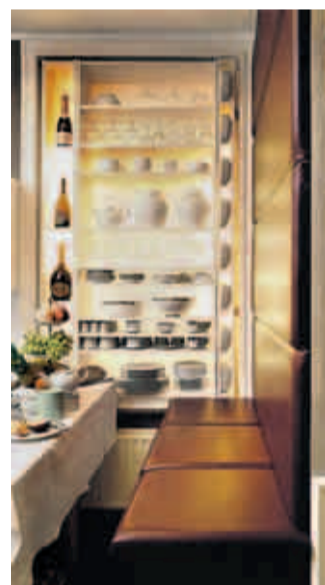
Der Essplatz: lederbezogene erhöhte Sitzbank am Tresen.